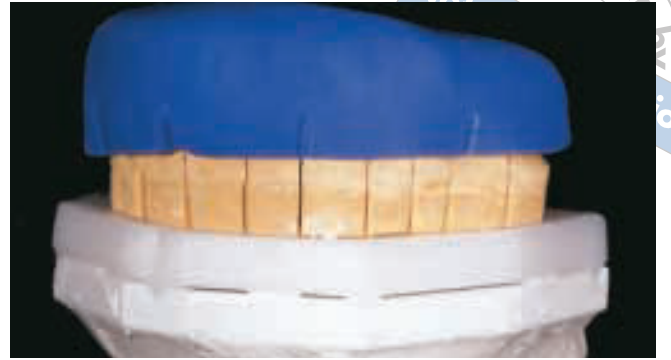
الشكل ٤: نقل الطبعة إلى المثال المصبوب للأسنان المحضرة على المطبق بعد تقطيعه لوحدة تمثل كل منها سن من أسنان الفك .

إجراءات العمل دون حدوث أية تغيير غير مقصود بالوضعية. يتم ملء المسافات بين الوحدات السنية ومناطق التثبيت undercut بالشمع ويُعزل المثال المصبوب بمادة عزل مناسبة وذلك قبل البدء بإجراءات مزج الأكريل الموقت (الشكل ٥) .