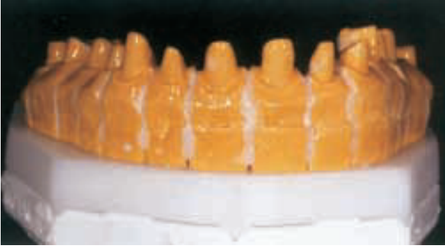
الشكل ٥: ملء الفراغات بين الوحدات السنية ومناطق التثبيت بالشمع ، ثم العزل بسائل SR Liquid.