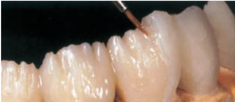
الشكل ١٠: تطبيق الملون Telio Stain الأبيض بكمية قليلة في مناطق ما بين الفصوص التكوينية للأسنان.

الذي قد ينتج عن انحصار الكمية الزائدة من الأكريل ضمن الطبعة. يُقدَّر زمن التصلب بـ ١٥ دقيقة ضمن الماء بحرارة (٥٠ درجة مئوية/ ١٢٢ فهرنهايت) وبضغط جوي تقريبي (٣ بار). تُظهر مادة الأكريل المستخدمة لوناً أساسياً مثالياً - اللون المختار لهذه المريضة A2 - إضافة إلى نعومة سطوح متجانسة مباشرة بعد إزالة الطبعة السيليكونية (الشكل ٧)، تجعل