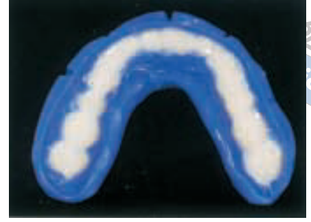
الشكل ٦: ملء الطبعة السيليكونية بمادة الأكريل الممزوجة في طور اللزوجة المنخفض.