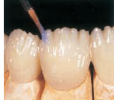
الشكل ٩: استخدام الملونات Telio Stain الأزرق لإضفاء التآثيرات المناسبة في منطقة الفصوص التكوينية.

سطوح مفعمة بالحوية ليبيدي التعويض المؤقت بعد الإنهاء والتلميع مظهر يماثل الأسنان الطبيعية (الشكل ١٢). يمكن للمرء عند مشاهدة التعويض المؤقت داخل الفم ملاحظة الأبعاد المنسجمة بسبب التفاصيل الدقيقة كالصدوع المينائية على السن ١١، والتلوين الأزرق إضافة إلى الفصوص التكوينية للأسنان ذات اللون الأبيض الفاتح. أعطت كل تلك التفاصيل حيوية مثالية للتعويض المؤقت، علماً بأن المواد المستخدمة في تصنيعها غير مخرشة وتدعم تشكّل اللثة للوصول إلى مظهر لثوي جيد (الشكل ١٣).