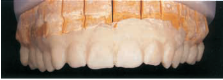
الشكل ٧: لاحظ السطح المتجانس مباشرة بعد إخراج الطبعة السيليكونية.