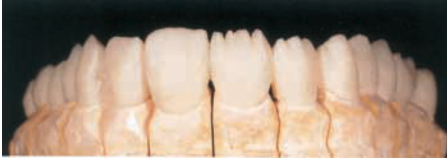
الشكل ٨: تحضير الأسنان لخلق الحيز المطلوب لتشكيل الفصوص والحدود القاطعة بواسطة السنايل.

الذي قد ينتج عن انحصار الكمية الزائدة من الأكريل ضمن الطبعة. يُقدَّر زمن التصلب بـ ١٥ دقيقة ضمن الماء بحرارة (٥٠ درجة مئوية/ ١٢٢ فهرنهايت) وبضغط جوي تقريبي (٣ بار). تُظهر مادة الأكريل المستخدمة لوناً أساسياً مثالياً - اللون المختار لهذه المريضة A2 - إضافة إلى نعومة سطوح متجانسة مباشرة بعد إزالة الطبعة السيليكونية (الشكل ٧)، تجعل