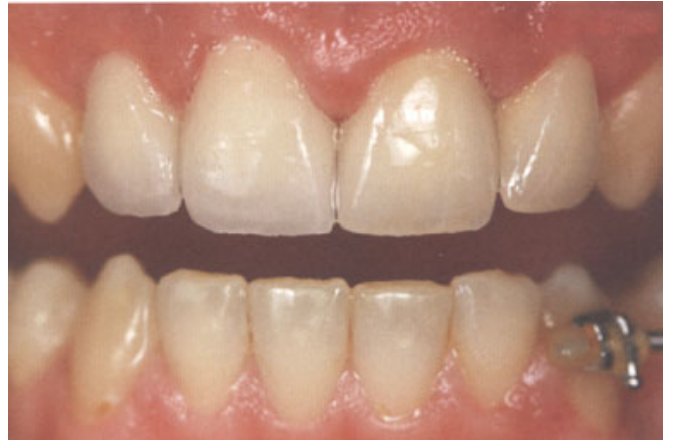
الصورة ٦: التيجان ١١٢ و ١١١: الحافة القاطعة الممددة باستعمال Enamel تظهر بوضوح.

ويؤدي ذلك للحصول على لمعان طبيعي المظهر (حالة نموذجية في الصور ١ حتى ٣).