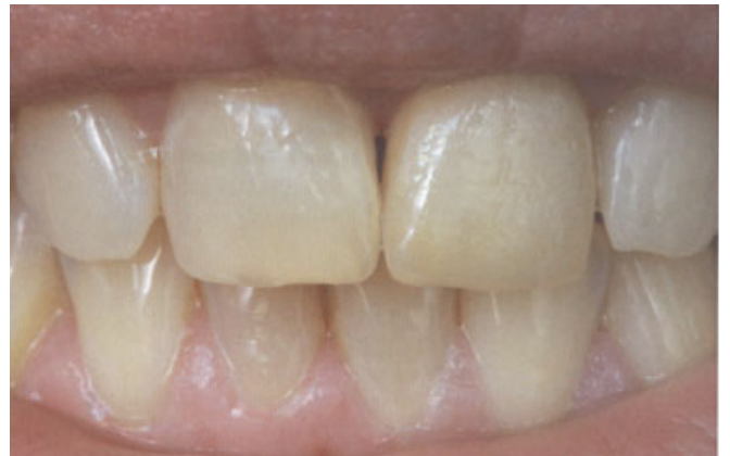
الصورة ٢: المراقبة بعدسة الكاميرا: يرى يوضوح المستوى العالي لبريق التزجيج بعد الشوي.