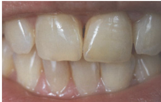
الصورة ٣: درجة بريق التاج ٢١ بعد التصحيح: تم تخميد بريق السطح بأداة صقل سيليكونية