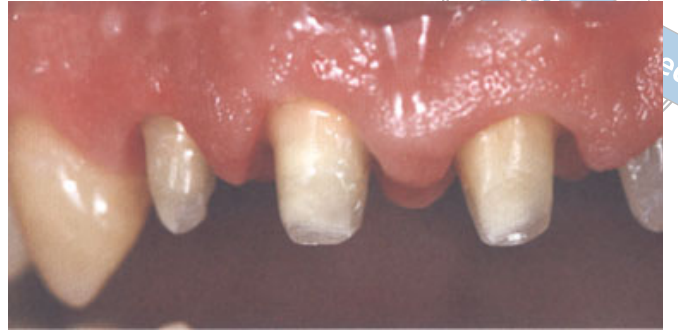
مثال الحالة ٢: