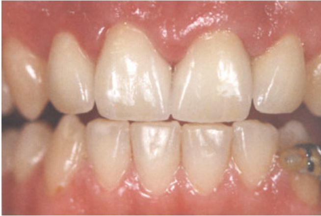
الصورة ٧: التيجان ٢١ و ٢٢: تعديل اللون: في المنطقة المركزية تقليل شدة اللون باستعمال ES 12 (رمادي أزرق). أما طبقة Enamel فقد لونت بخفة باستعمال BS01 (الأبيض) و BS03 (البرتقالي). وتم تقوية مظهر الحافة القاطعة باستعمال BS01.