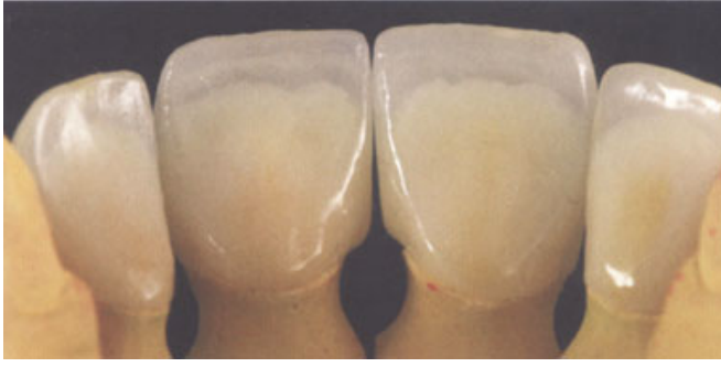
الصورة ٥: تيجان من الخزف التام مصنوعة بتقنية Cutback بعد الشوي. الحواف القاطعة أطول من اللزم وشفافة نتيجة التمديد باستعمال ENAMEL.