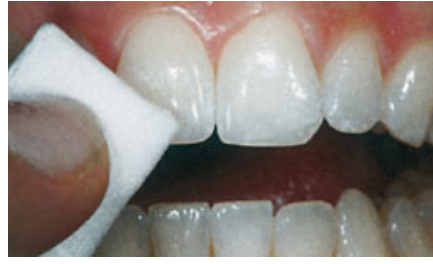
الصورة ٤: تجفيف الأسنان بخرقة ذات قدرة امتصاص عالية.

حال عدم القدرة على تجنب ذلك فيمكن أن يشعر المريض بخرقة بسيطة تختفي بعد مدة وجيزة. يزال الطلاء بعد مدة تأثير بقدر عشر دقائق - مثلاً بإستعمال مسبر - ومن ثم تطلى طبقة جديدة على السطح المجفف. ويتم تكرار هذه العملية خمس مرات. وقد أثبتت عدة دراسات فعالية هذه الطريقة. ويقيم المعالجون طريقة المعالجة بالطلاء بالمقارنة مع تطبيق محاليل بيروكسيد الهيدروجين العالية التركيز في العيادة السنية بكونها واقية ومريحة أكثر للمريض.