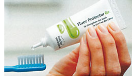
الصورة ٥: ينصح خلال معالجة التبييض بالعناية بالأسنان بإستعمال هلامه Fluor Protector الحاوية على الكالسيوم والفلوريد والفوسفات.