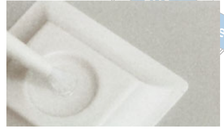
الصورة ٣: كمية الطلاء في وعاء التوزيع تكفي للفك العلوي والسفلي.

حال عدم القدرة على تجنب ذلك فيمكن أن يشعر المريض بخرقة بسيطة تختفي بعد مدة وجيزة. يزال الطلاء بعد مدة تأثير بقدر عشر دقائق - مثلاً بإستعمال مسبر - ومن ثم تطلى طبقة جديدة على السطح المجفف. ويتم تكرار هذه العملية خمس مرات. وقد أثبتت عدة دراسات فعالية هذه الطريقة. ويقيم المعالجون طريقة المعالجة بالطلاء بالمقارنة مع تطبيق محاليل بيروكسيد الهيدروجين العالية التركيز في العيادة السنية بكونها واقية ومريحة أكثر للمريض.