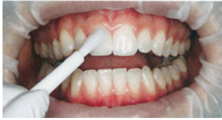
الصورة ١: التطبيق المباشر لطلاء VivaStyle Paint On Plus. يسهل الحاجز المطاطي OptraGate الواقي للشفتين والخدين المعالجة.