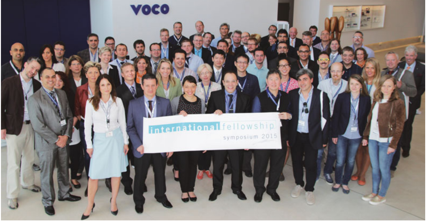
جاء أكثر من ٥٠ طبيب أسنان وفني مخبر سني من حوالي ٢٠ دولة للمشاركة في الندوة الثانية للزمالة الدولية (VIFS) لشركة VOCO في مدينة Cuxhaven.

حالات الصدمات السنية، والعمل بسبليكون النماذج وأنظمة التثبيت في الترميمات غير المباشرة، وكذلك تصنيع التعويضات المؤقتة العالية الجمالية. عدى ذلك شمل برنامج المحاضرات التطبيقية الصحيح لمستحضرات التبييض وكذلك تقييم مادة شفافة سادة للشقوق بعد مرور سنة على وجودها داخل الفم. وتم عرض ومناقشة هذه المواضيع وغيرها من خلال حالات سريرية مختارة، تظهر الأستعمال الناجح لمنتجات VOCO المعروفة والمجربة منذ زمن طويل والجديدة كذلك.