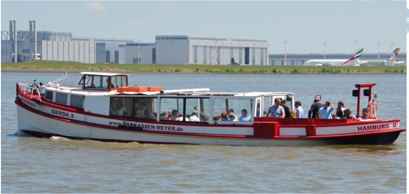
نقلت القوارب المشاركين في ندوة VIFS إلى هامبورغ ومروا في أثناء ذلك بمصنع شركة Airbus في منطقة Hamburg-Finkenwerder.